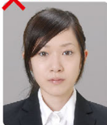
薄すぎ マイナスメイク

すべてをマイナスしすぎて疲れたさみしい印象を与えます。顔色が悪く見えてしまうので印象はあまりよくありません。