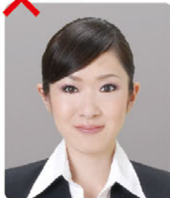
パーツ強調 プラスメイク

囲み目は目を大きく印象良く見せれると思ったら大違い。逆に怖い印象を与えます。不自然に見えてしまうのでNG。