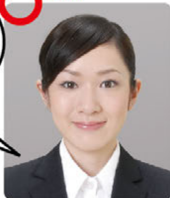
きれいめ上品 好印象メイク

目元・口元を上品に仕上げているので顔色も良く、明るい自然な仕上がりになっています。健康的で好印象なメイクです。